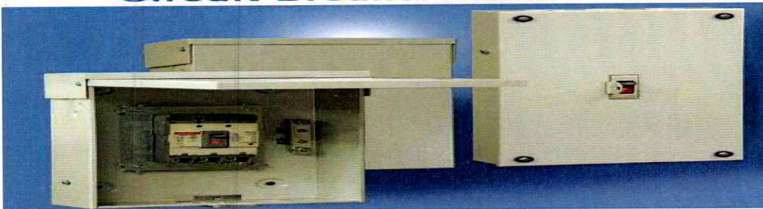
Circuit Breaker Enclosure